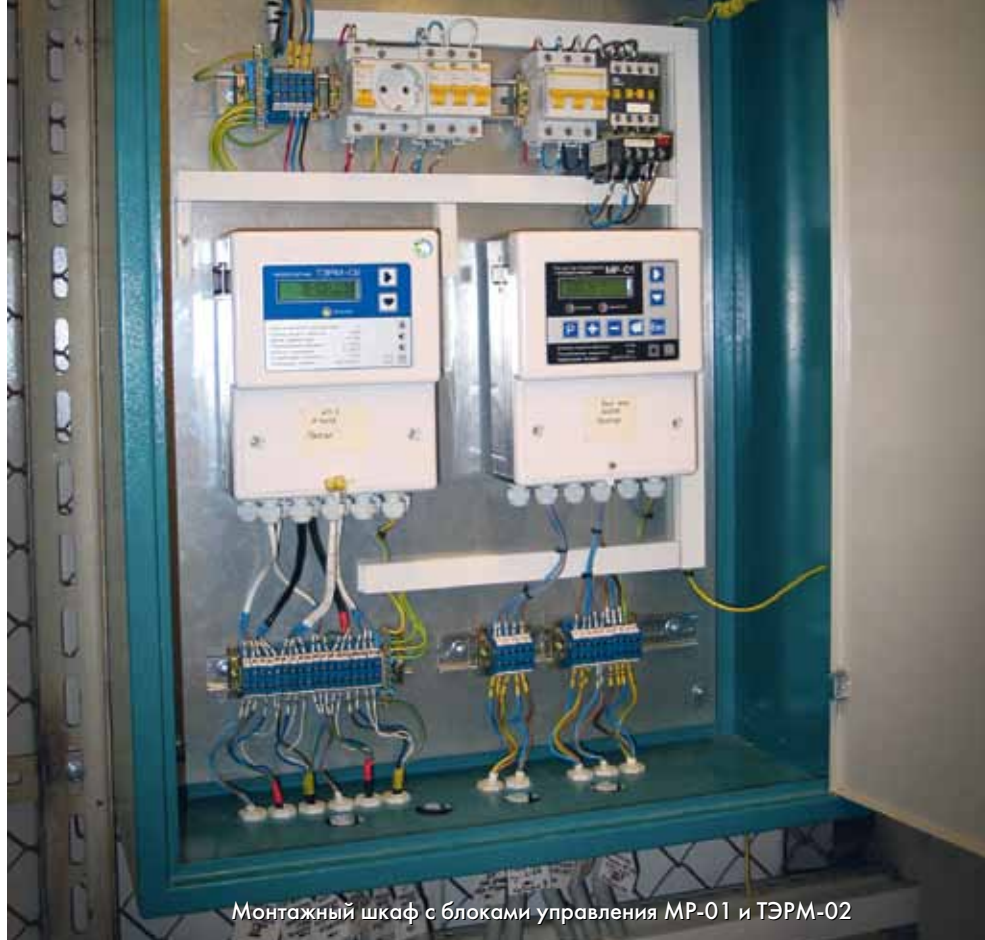
Монтажный шкаф с блоками управления МР-01 и ТЭРМ-02

Необходимость экономии энергоресурсов и наличие современного регулирующего оборудования стимулировали процесс автоматизации систем теплоснабжения.